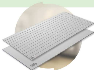
ผนังสมาร์ทบอร์ด เอสซีจี SCG SmartBOARD